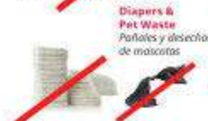
Diapers & Pet Waste Pañales y desechos de mascotas