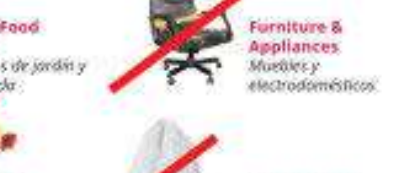
Furniture & Appliances Muebles y electrodomésticos