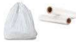
Plastic Bags & Wrap Bolsas y envoltura de plástico