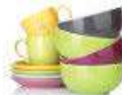
Dishes & Mirrors Platos y espejos