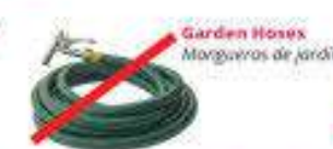
Garden Hoses Mangueras de jardín