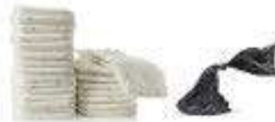
Diapers & Pet Waste Pañales y desechos de mascotas