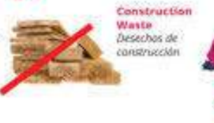
Construction Waste Desechos de construcción