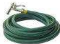
Garden Hoses Mangueras de jardín