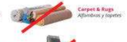
Carpet & Rugs Alfombras y tapetes