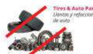
Tires & Auto Parts Llantas y refacciones de auto