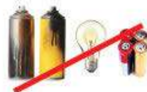
Hazardous Waste Desechos peligrosos

For information on Not Acceptable Items please call UWS Customer Service at (619) 814-6310 Para información acerca de Artículos No Aceptables llame a UWS Servicio al cliente al (619) 814-6310