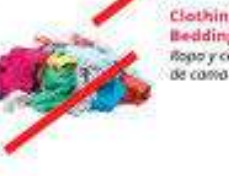
Clothing & Bedding Ropa y cobertores de cama