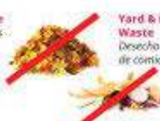
Yard & Food Waste Desechos de jardín y de comida