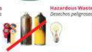
Hazardous Waste Desechos peligrosos