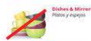
Dishes & Mirrors Platos y espejos