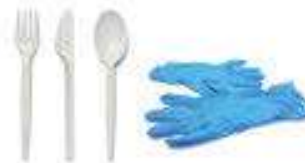
Non-Recyclable Plastics Plásticos no reciclables