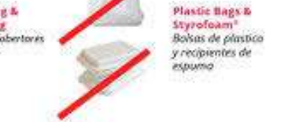
Plastic Bags & Styrofoam® Bolsas de plástico y recipientes de espuma

For information on Not Acceptable Items please call UWS Customer Service at (619) 814-6310 Para información acerca de Artículos No Aceptables llame a UWS Servicio al cliente al (619) 814-6310