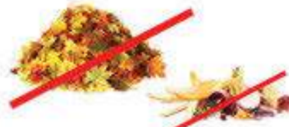
Yard & Food Waste Desechos de jardín y de comida